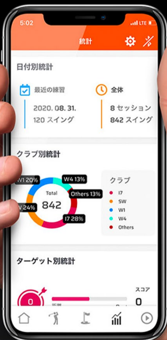
▲STATSメニュー ショット記録